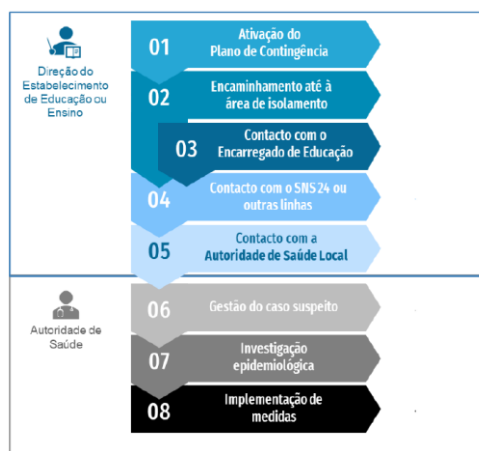
Fluxograma de atuação perante um caso suspeito de COVID-19 em contexto escolar

Perante a deteção de um caso suspeito de COVID-19 de uma pessoa presente em qualquer UO do Agrupamento de escolas de Escariz, deverão ser tomados os seguintes passos em estreita articulação Escola – Família - Saúde: