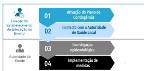
Figura 2. Fluxograma de atuação perante um caso confirmado de COVID-19 em contexto escolar

Se o caso confirmado tiver sido identificado fora do estabelecimento de educação ou ensino, devem ser seguidos os seguintes passos: